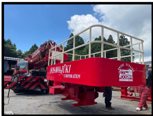
[SKYBOX SS-300 (上) SS-150 (下)]